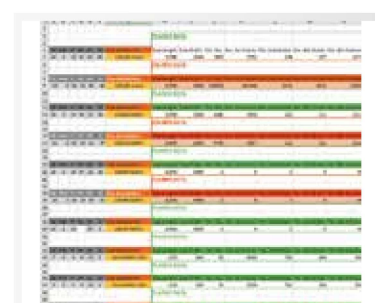
CONDIVISIONE DATI REMOTA REMOTE DATA SHARING